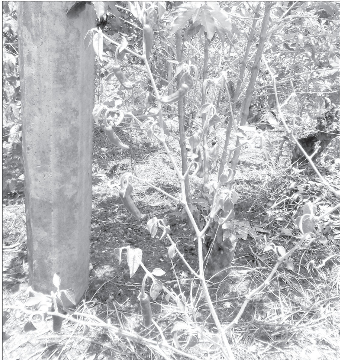
Arbusto de chile congo