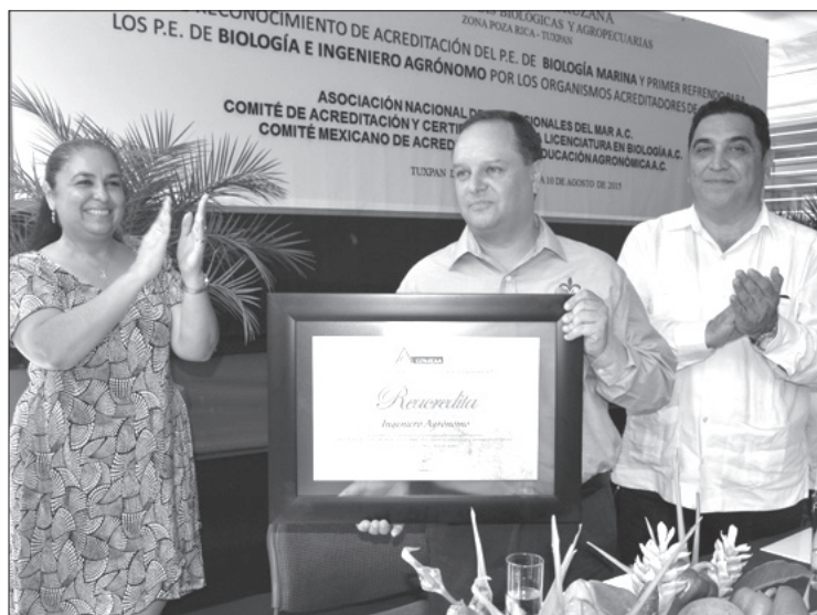
La Rectora destacó la importancia del trabajo en equipo

La Rectora también asistió, el 9 de agosto, a una reunión de trabajo en la Universidad Veracruzana Intercultural (UVI), sede Totonacapan –ubicada en el municipio de Espinal–, a propósito del Día Internacional de los Pueblos Indígenas, y recorrió las instalaciones de dicha entidad académica para corroborar los avances en su construcción.