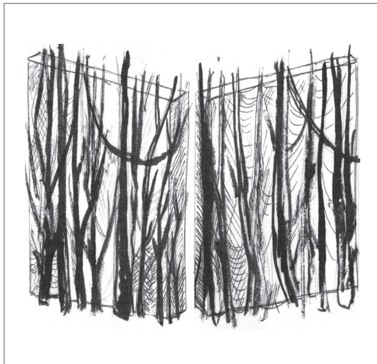
Las ilustraciones son autoría de Marta Palau

Para todos aquellos interesados en adquirir el número 122 de Tramoya y ediciones anteriores, pueden acudir al Servicio Bibliográfico de la UV, ubicado en Xalapeños Ilustres número 37, en la ciudad de Xalapa.