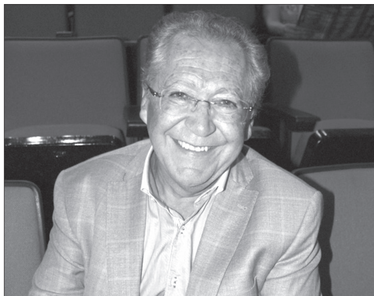
El académico visitó la UV