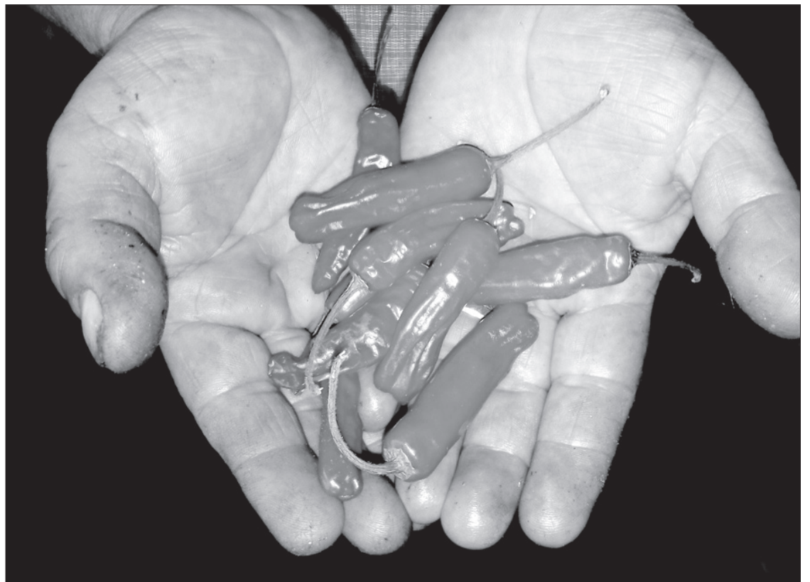
El chiltepín es nativo de la comunidad