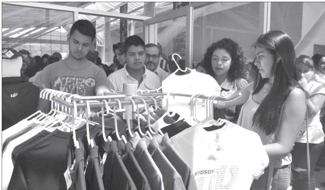
Productos oficiales de la institución, disponibles para la comunidad

Cabe destacar que como promoción por inauguración, todos los productos tienen 10 por ciento de descuento. El horario de atención es de 9:00 a 18:00 horas.