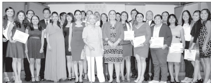
La Rectora presidió la ceremonia

Asimismo, en 2005 el Conacyt le otorgó el nivel II (Programa educativo en desarrollo). Cuatro años después, luego de una nueva reestructuración del plan de estudios, le otorgó el nivel III (Programa consolidado), y en octubre de 2014 obtuvo el nivel IV, el máximo (de Competencia internacional).