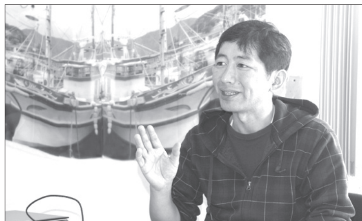
Es profesor de la Universidad del Diseño en Kobe

"Pienso que el sentido del arte que hay en la comunidad crece, mejora, y esto construye un mundo mejor. Creo que el arte que se produce en Japón y en México tienen cualidades de belleza semejantes; además, al realizar este proyecto se crea una nueva conexión entre Japón y México."