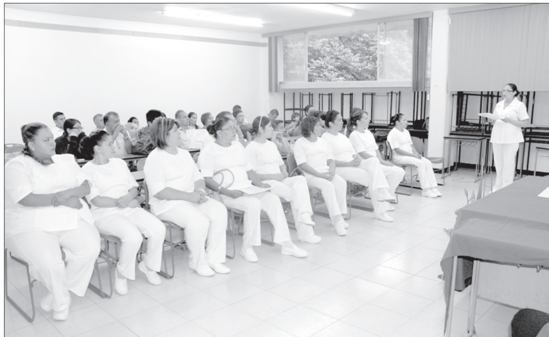
Integrantes de la cuarta generación

En la actualidad, la Facultad de Enfermería ofrece cuatro posgrados: Especialidad en Salud Materna y Perinatal, Especialidad en Cuidados Intensivos del Adulto en Estado Crítico, Maestría en Enfermería y próximamente la Especialización en Administración y Gestión en los Servicios en Enfermería.