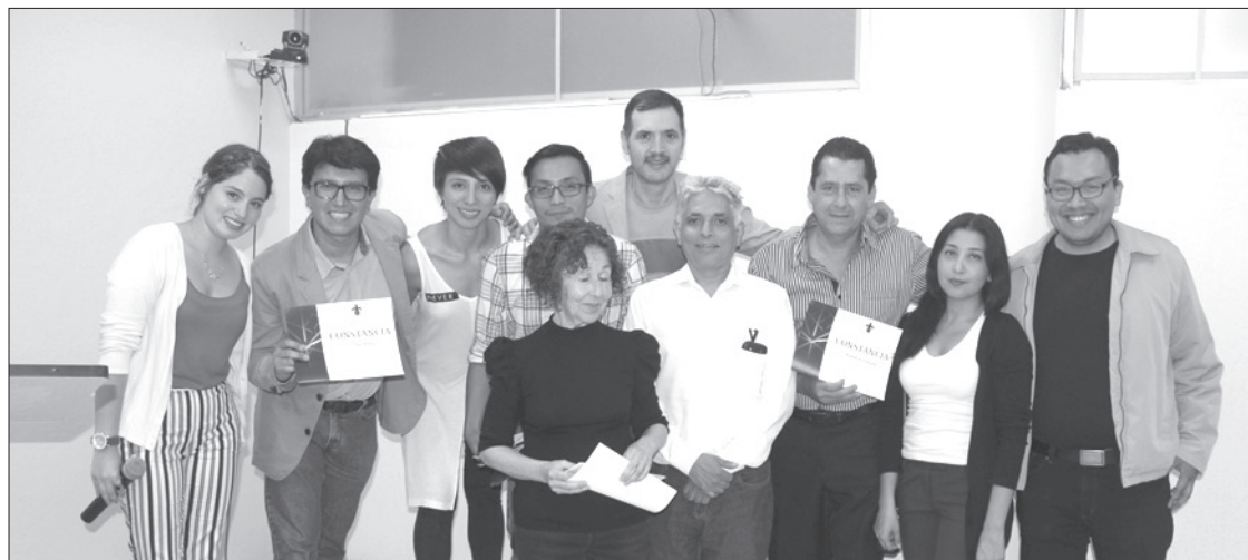
Equipo que participó en la realización