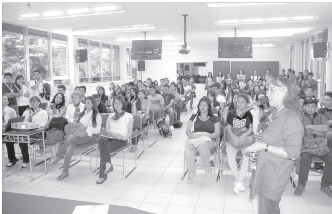
Los jóvenes conocieron pormenores de su licenciatura

Por ello, es muy importante que los alumnos conozcan el comportamiento de cada una de las patologías y cómo orientar