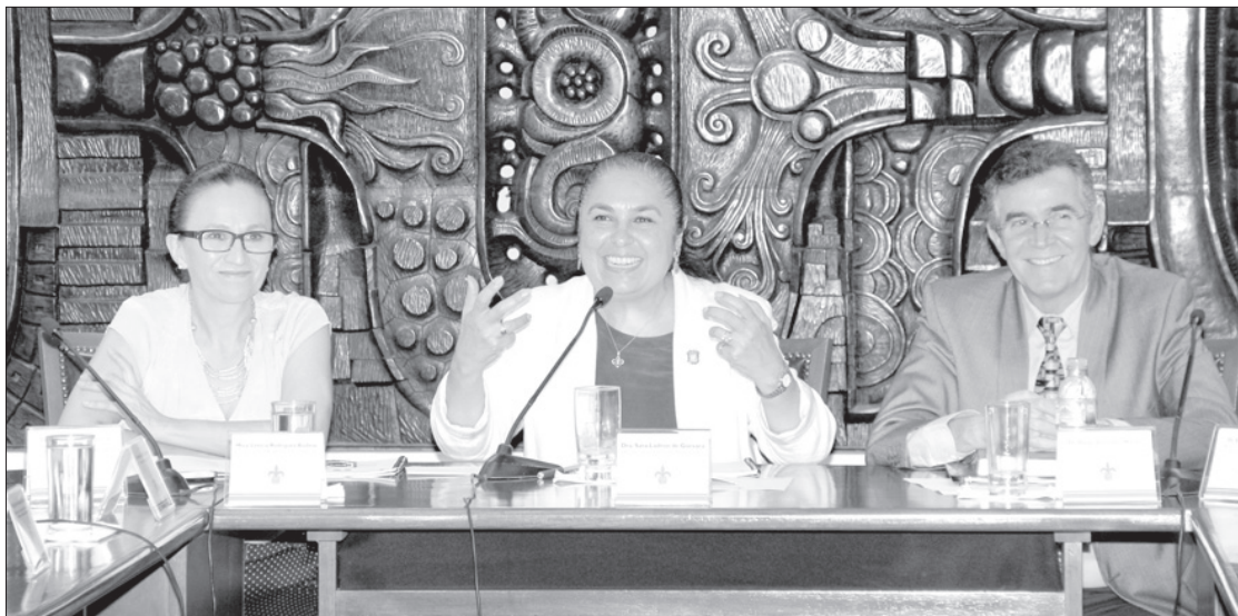
La Rectora expuso el trabajo en salud a la OPS

En reunión de trabajo efectuada en la Rectoría participaron los integrantes de los distintos programas que articulan el área de la salud en la UV, quienes expusieron los avances institucionales; posteriormente la Rectora destacó el trabajo realizado por miembros de la comunidad académica que durante años se han dedicado a la formación de recursos humanos y a la investigación en este ámbito.