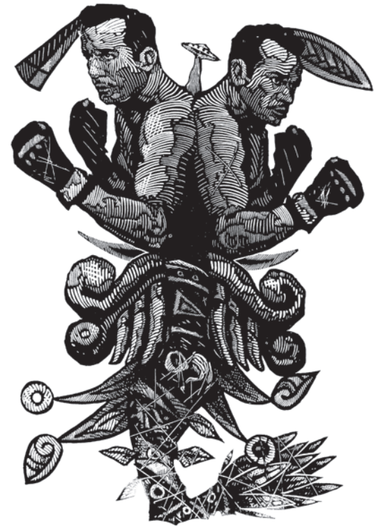
Pieza integrante de Ensayos y materiales defectuosos

¿Ya es tiempo de hacer tu Servicio Social?