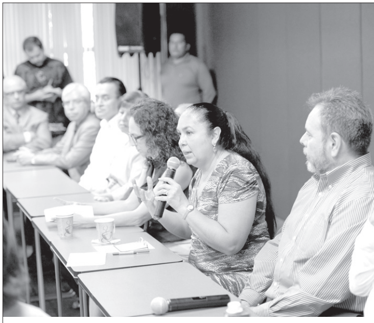
La Rectora Sara Ladrón de Guevara inauguró el taller para académicos

Añadió que es un tema que debe formar parte del ser universitario y muestra la importancia que esta problemática tiene para la institución; asimismo reconoció que en la UV han ocurrido casos que permiten constatar una intolerancia y estigmatización, así como una falta de aprecio por las diversidades y las problemáticas que se viven hoy en día.