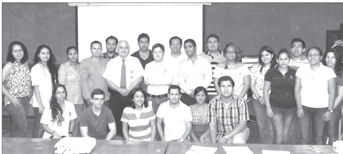
Prestadores de servicio social recibieron capacitación

“Es donde realmente la Universidad se sale de las aulas,