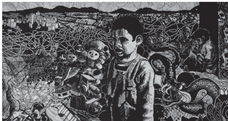
Obra de Salvador Zacarías

La Galería AP se ubica en Belisario Domínguez número 25 en el centro de Xalapa.