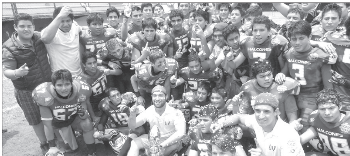
Se confirmaron como los mejores de la Temporada 2015