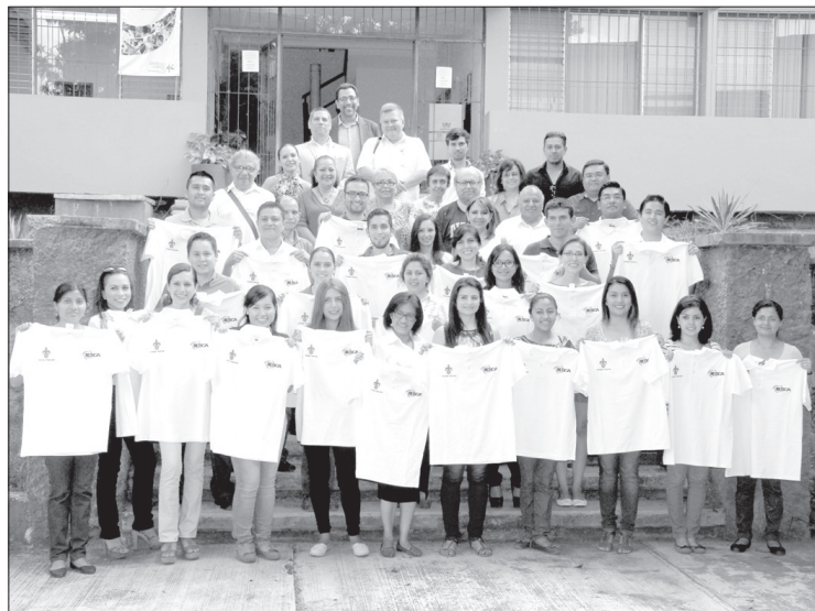
Alumnos y docentes del instituto