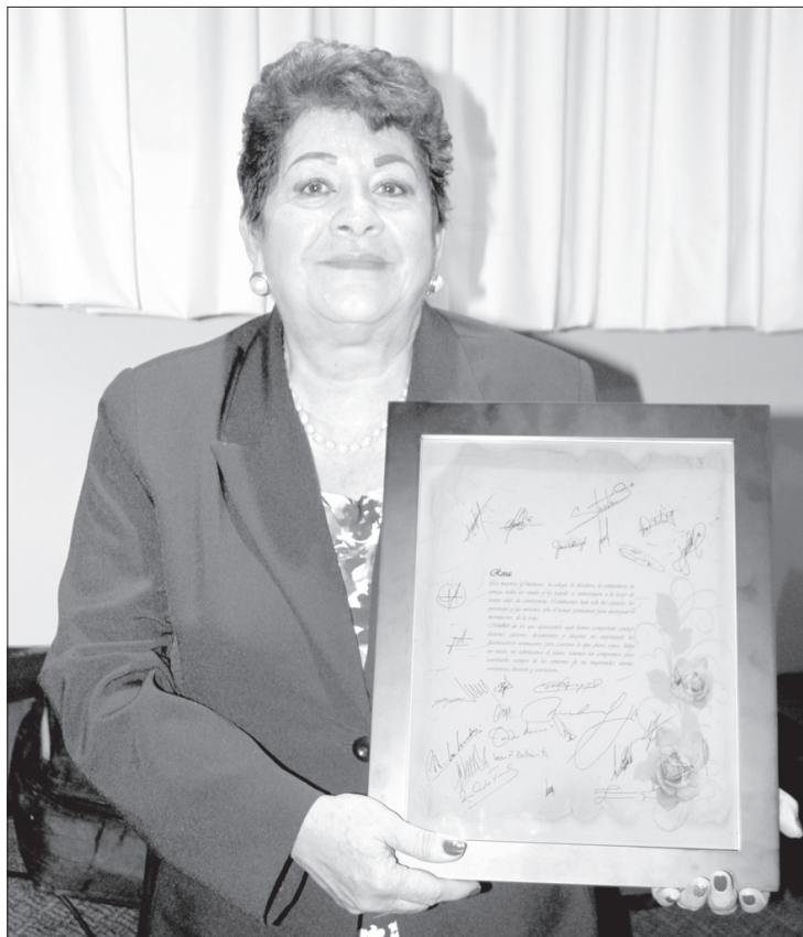
La comunidad del instituto le rindió homenaje

”Es una vida muy plena en la que siento que aún puedo dar mucho,