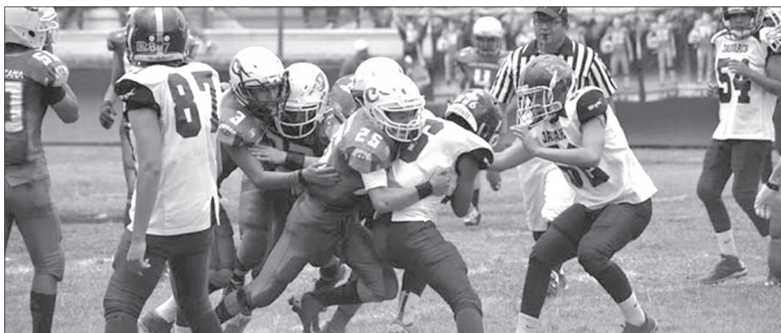
Vencieron 20-14 a Jaguares de Coacalco