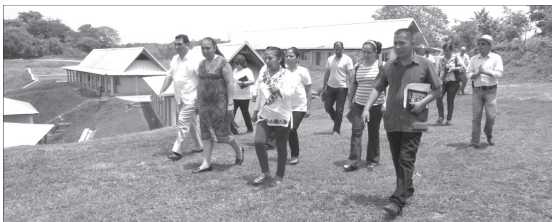
También visitó las instalaciones de la UVI-Totonacapan