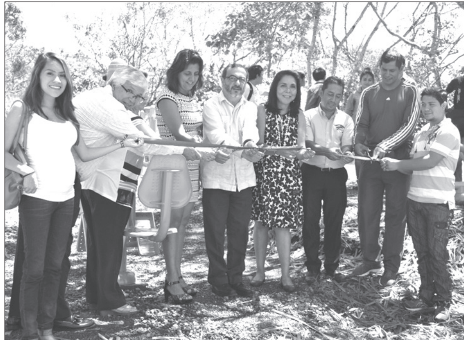
Corte de listón inaugural

Cuenta con 11 aparatos para realizar ejercicio