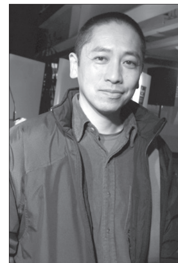
Es integrante del IAP

Se buscan Guadalupes es una mirada que busca indagar sobre el