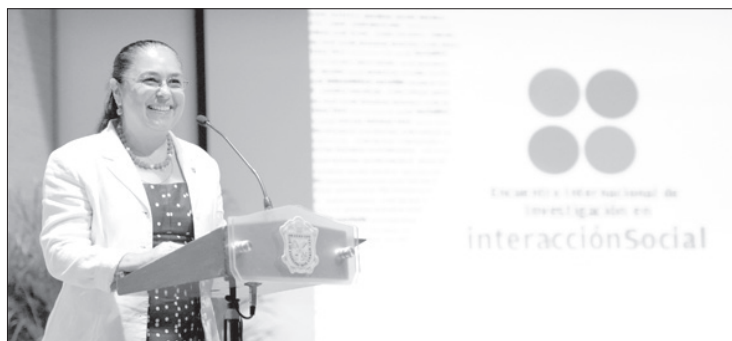
La rectora inauguró el encuentro

Consideró que el LIS es también un referente nacional e internacional en el terreno del análisis psicológico, pues ha puesto en la mira de su labor temas de interés universal como la cooperación, competencia, individualismo, desarrollo psicológico y sus cambios, resultado de las condiciones sociales: demografía, globalización, migración y economía, entre otras.