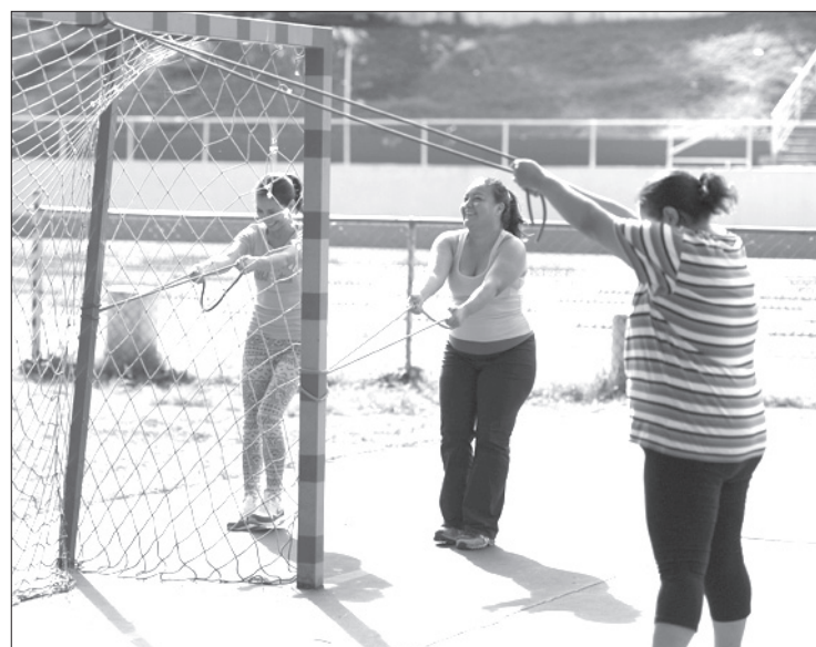
La activación física tuvo buena respuesta

Agregó que se trató de llevar a los papás por el camino de entender y hacer actividad física en casa, más allá de que muchas veces comentan que no tienen tiempo. "Los orientamos para