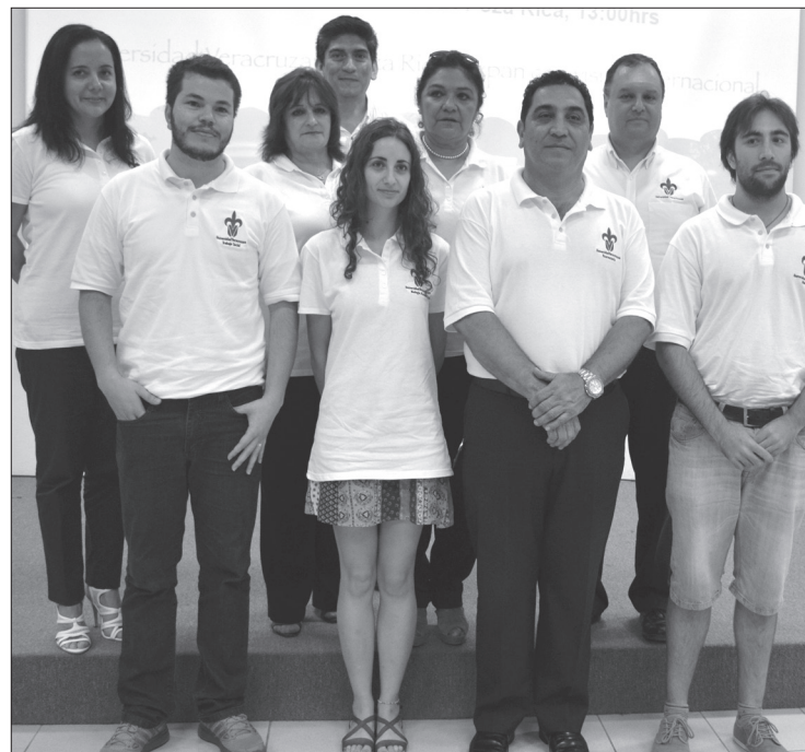
Autoridades dieron la bienvenida a estudiantes extranjeros