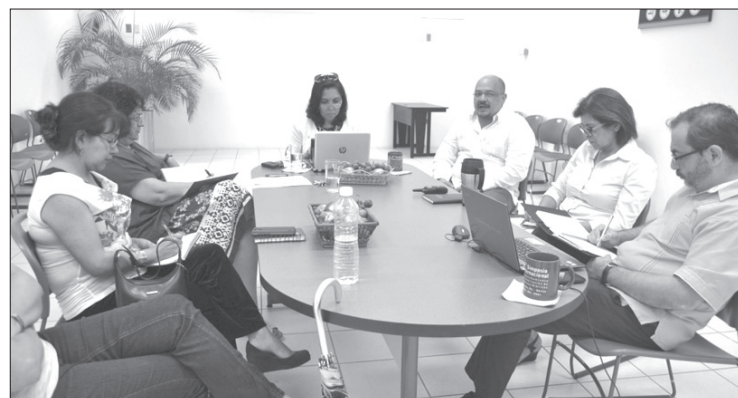
Ambas instituciones estrecharon lazos de colaboración

También se abordó la importancia de que la Universidad establezca en la zona un jardín etnobotánico que se convierta en un importante soporte para el estudio, rescate y conservación del patrimonio histórico, cultural y ecológico; que a través de la sensibilización entre la población se rescaten