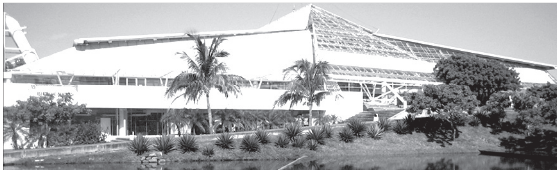
La USBI-Veracruz será la sede del evento

Los trabajos aceptados serán publicados el 25 de septiembre en la página de la Facultad: http://www.uv.mx/veracruz/nutricion/ Para mayores informes dirigirse al correo electrónico foroinvestnutver@uv.mx o visitar la página de Facebook citada.